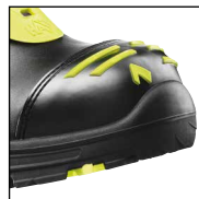
HAIX® High Durability Cap System