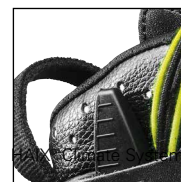
HAIX® Climate System