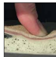
Système de mousse injectée HAIX® MSL